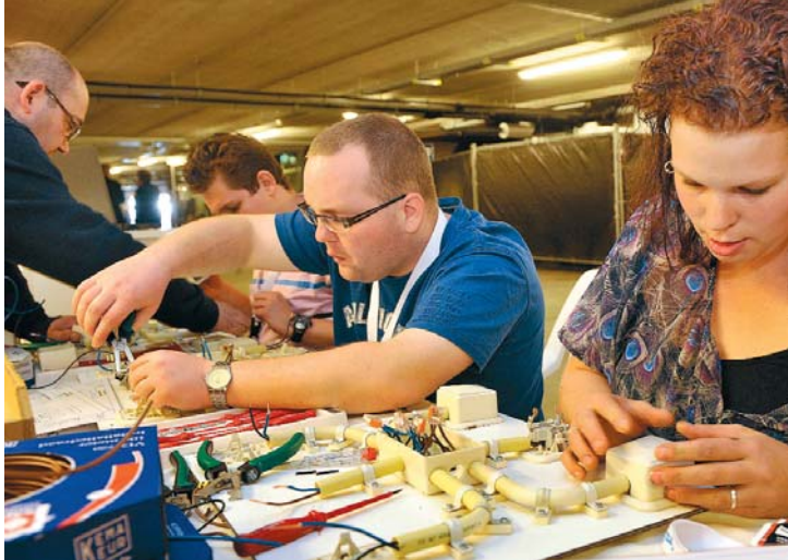
Workshop electro- techniek

het Zumba-dansen waar ze net aan meegedaan heeft. Kinderen hollen door de hal, ballonnen in de hand. In de kelder van het gebouw kunnen zij kleuren en knutselen, terwijl hun moeders een workshop volgen of informatie inwinnen bij een stand over een opleiding of werkgever. Het ijs en de pannenkoeken nemen gretig aftrek.