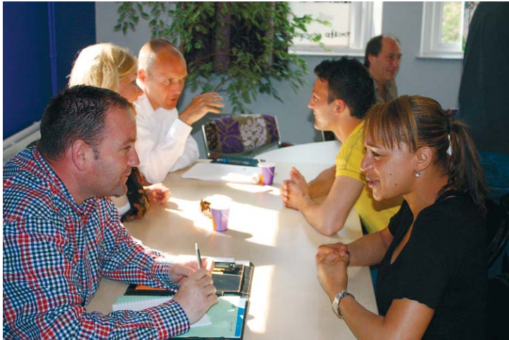
Speeddaten: jongeren- coaches en de klankbordgroep

tijdens zo'n koffie-uurtje aan Myra. Het antwoord kwam snel. "Een eigen woninkje, een lieve vriend en een kindje. Maar ik zou niet thuis willen blijven. Een kind is leuk, maar niet de hele dag."