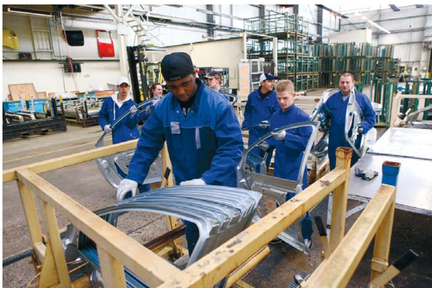
Amersfoortse jongeren in een leer-werkbaan bij voestalpine Polynorm