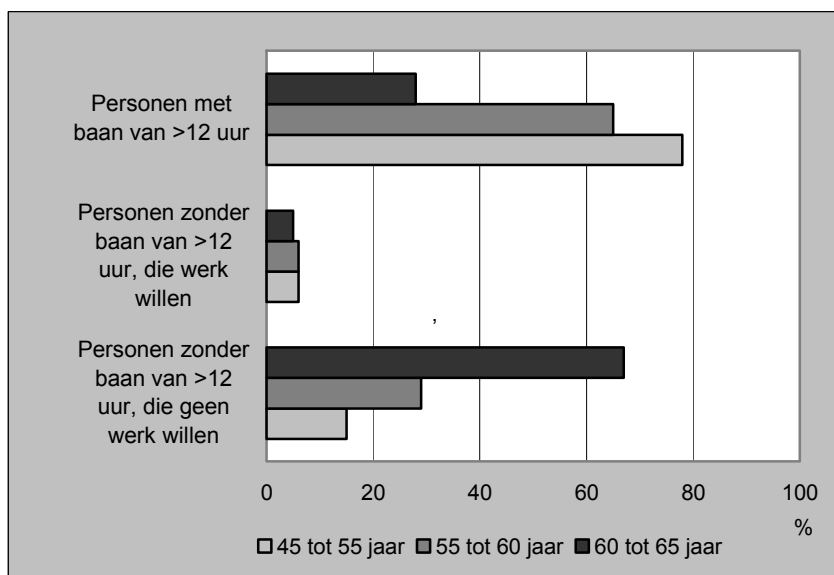
1. Arbeidsmarktpositie van personen van 45 tot 65 jaar, 2009

De niet-werkzame bevolking heeft geen baan of een kleine baan van minder dan twaalf uur per week (hierna personen zonder baan genoemd). Personen zonder baan zijn te verdelen in personen die een baan willen van meer dan twaalf uur per week of personen die dat niet willen of kunnen. Ruim acht op de tien ouderen zonder baan behoren tot de tweede categorie.